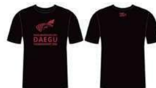
T-シャツ 35,000₩ (21€)