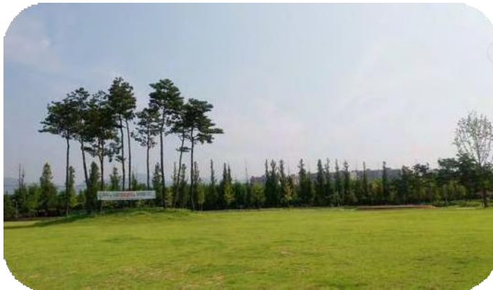
<水城ファミリーパークビュー>

ゴルフ場、インラインスケートトラック、子供用水遊び場があります。トレイルはランニング中に自然を体験するのに理想的な場所です。大邱スタジアム(メインスタジアム)から水城ファミリーパークまでは車で12分の距離です