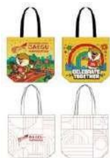
再利用可能バッグ 10,000₩ (6€)