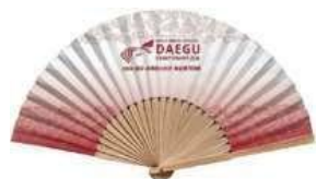
扇子 10,000₩ (6€)