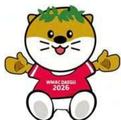
マスコット人形 30,000₩ (18€)

Discover more products online and in stores!