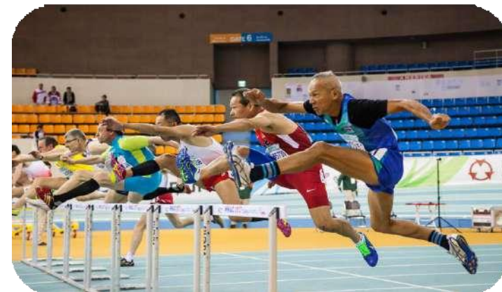
<WMACi 大邱 2017>