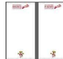
タオルセット 30,000₩ (18€)