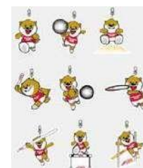
アクリルキーリング 7,000₩ (4€)