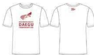
T-シャツ 35,000₩ (21€)