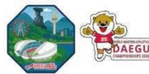
ヒートパッチ 8,000₩ (5€)