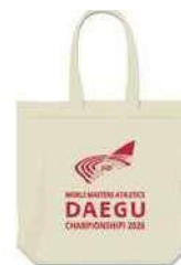
布袋 18,000₩ (11€)