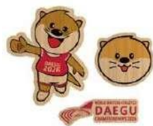
木材マグネット 8,000₩ (5€)