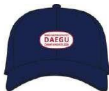
キャップ 32,000₩ (19€)