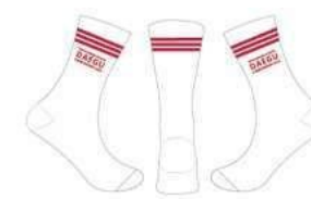
靴下(1人用) 6,000ウォン (4€)