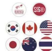
ピンバッジ 2,000₩ (1€)