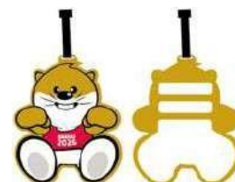
荷物 タグ 13,000₩ (8€)