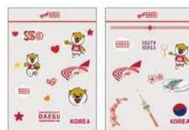
デカールタトゥー 8,000₩ (5€)