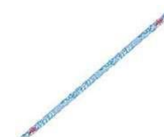
スポーツ スカーフ 12,000₩ (7€)