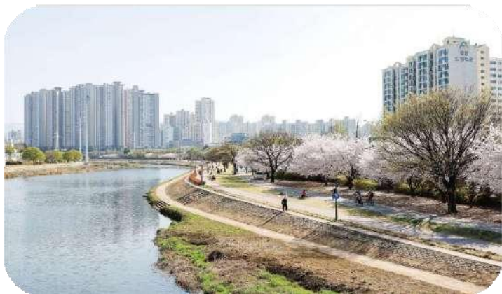
<新川洞路とカワウソ>

ハーフマラソンコースである新川洞路は、大邱の中心部を南から北に流れる新川川沿いに位置しています。さらに、季節に応じてプールやスケートリンクがあり、さまざまなトレーニングや便利な施設も整っています。新川全域に樹木や野花が生い茂り、この小川には選手権の指定自然記念物でマスコットであるカワウソが一級水域で暮らしています。多くの地元住民がトレーニングやレジャーのために訪れ、このコースは新鮮な空気と風の中でランニングを楽しむ理想的なルートとされています。