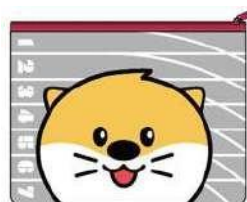
ポーチ 5,000₩ (3€)