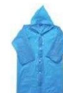
ポンチョ 4,000₩ (2€)