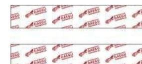
K-テープ 10,000₩ (6€)