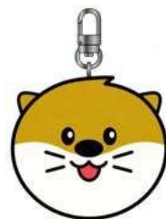
キーリング 人形 12,000₩ (7€)