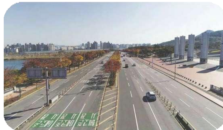
<スタジアムとウォームアップ施設のロードビュー>

10kmのロードランと10kmおよび20kmの競歩コースは、アスリートプロモーションセンター(ウォームアップ施設)からスタートし、大邱スタジアム(メインスタジアム)を回り、大邱サムスンライオンズパーク、大邱美術館、大邱関城美術館のそばを通ります。ロードイベントは、山々と湖に囲まれた自然に優しいルートで行われ、そよ風と清らかで新鮮な空気が楽しめます。