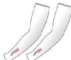
アームスリーブ 7,000₩ (4€)