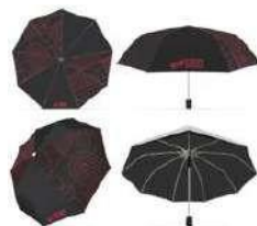
傘 20,000₩ (12€)